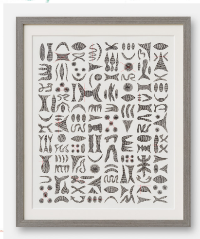
「石積み」に刻む02」2023年

これまでの主な展覧会に、art resonance vol.01「時代の解凍」芦屋市立美術館(兵庫/2023年)、VOCA展2022 現代美術の展望—新しい平面の作家たち—上野の森美術館(東京/2022年)、大阪府 20世紀美術コレクション展「彼我の絵鑑」大阪府立江之子島文化芸術創造センター(大阪/2021年)、個展「埋没する形象、組み変わる景色」国際芸術センター青森(青森/2020年)など。